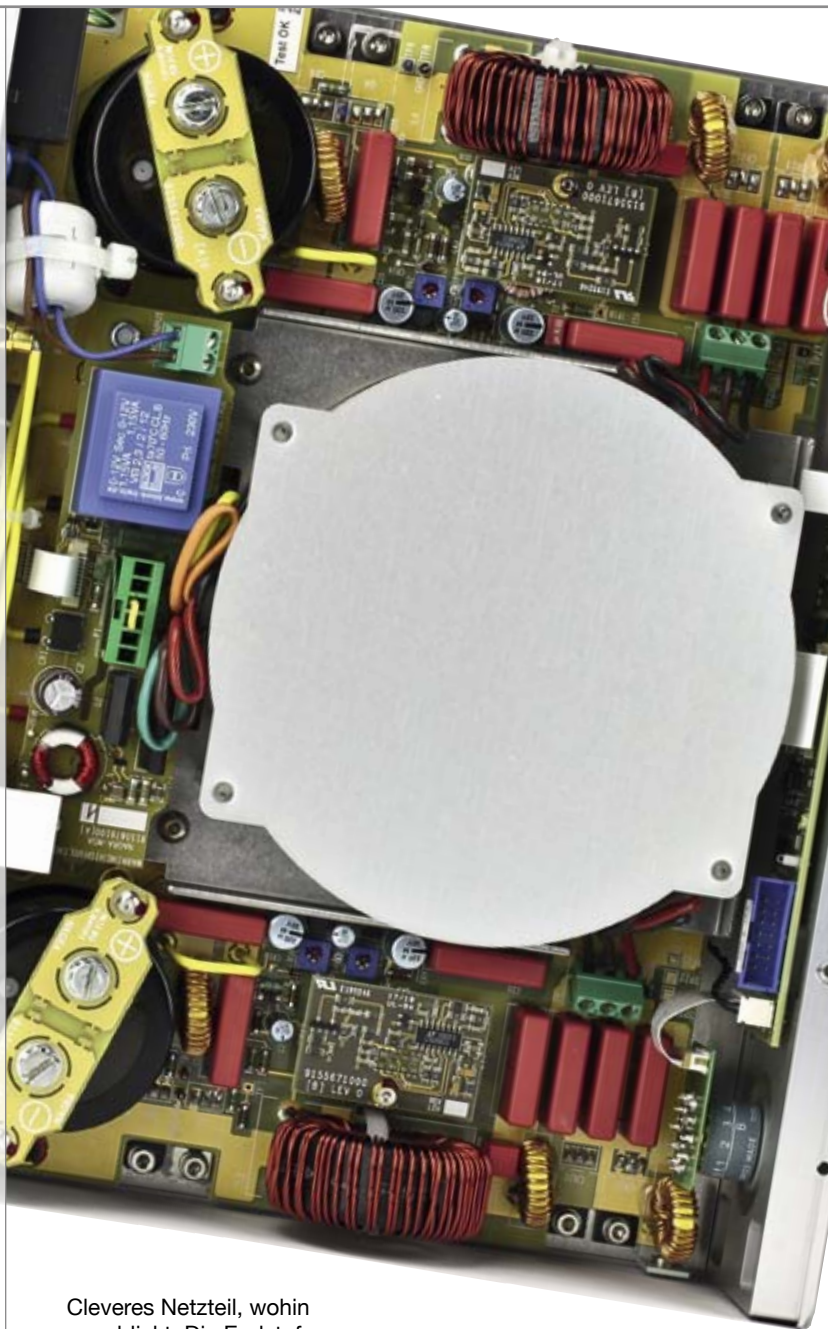
Cleveres Netzteil, wohin man blickt. Die Endstufe steckt unter dem Trafo

Unterschiede finden sich vor allem in der Wahl der verstärkenden Elemente – aufwendige Röhrenschaltungen in der Jazz vs. kostengünstigere